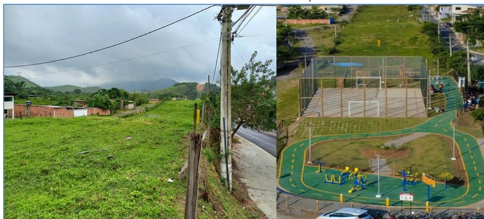
Figura 3: Registro de obra – antes e depois - do Programa Faixa em Movimento em Paracambi/ Rio de Janeiro)