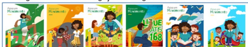
Figura 1: Cards de divulgação do Programa Faixa em Movimento

Para a realização de uma entrega que faça sentido para a comunidade, o processo de produção inclui a participação dos engenheiros da obra em reuniões comunitárias para entender as necessidades e complexidades locais envolvidas. O fazer-com a comunidade é guiado por uma equipe multidisciplinar que garante a elaboração colaborativa e comunicação sobre o processo.