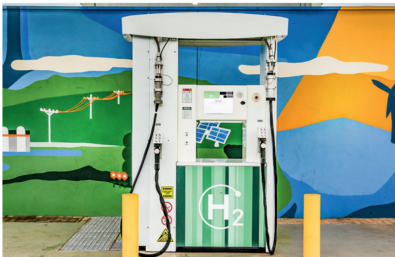
Estação de abastecimento tem boca de H35 (350 bar) e de H70, com 700 bar. A pressão mais baixa é usada em veículos pesados e a mais alta, em automóveis

Antes de aprofundar a conversa no carro, porém, é necessário falar sobre química, física e até sobre o universo (mas sem filosofar). Porque é difícil encontrar hidrogênio para abastecer, mas ele está em todos os lugares: é o elemento mais abundante do universo e o terceiro elemento mais comum na superfície terrestre, porque cada molécula de água é formada por dois átomos de hidrogênio e um de oxigênio, e o brilho do Sol vem da fusão do hidrogênio no núcleo desse astro.