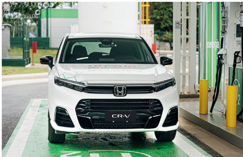
CR-V eFCEV tem dianteira exclusiva, mas não abre mão da grande tomada de ar como outros elétricos: a admissão de ar é fundamental para gerar energia