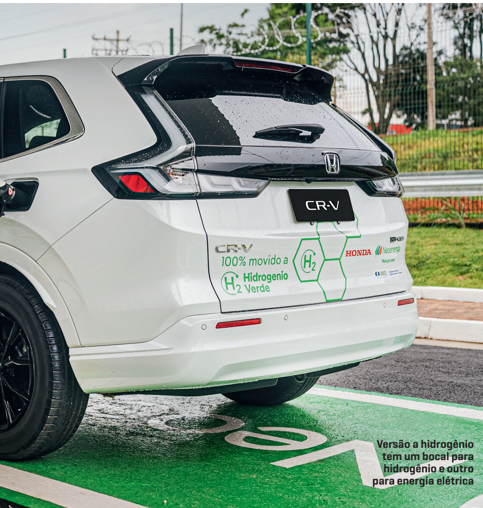
Versão a hidrogênio tem um bocal para hidrogênio e outro para energia elétrica