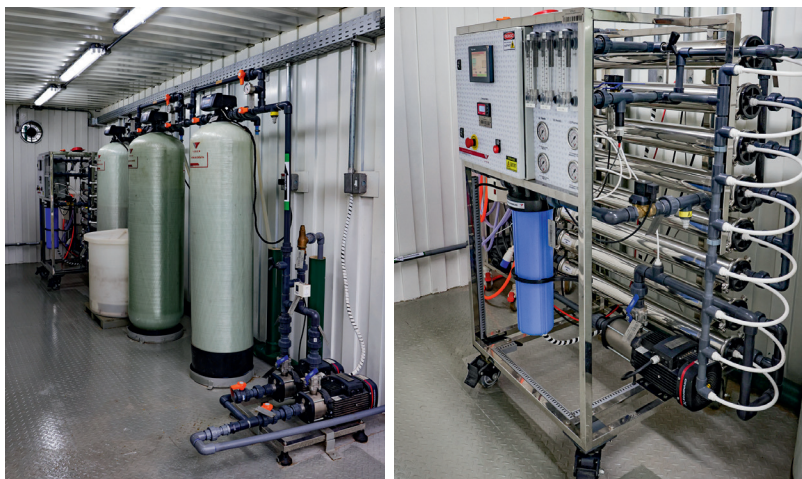
Processo de fabricação de hidrogênio verde usa água como principal ingrediente. Ela vem do sistema de abastecimento público e é purificada em várias etapas