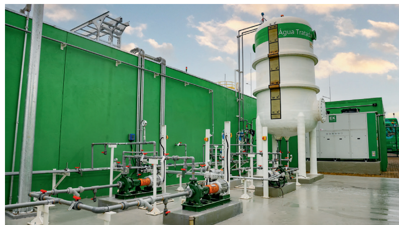
A água consumida na fabricação do hidrogênio verde volta para a natureza: quando o carro consome o combustível, libera água e vapor de água