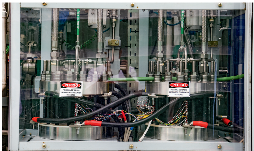
É dentro dos eletrolisadores que a água é bombardeada com uma carga elétrica controlada, para que as moléculas de hidrogênio e a de oxigênio se separem