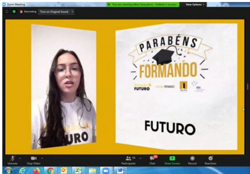
Figura 1: Em 2020, o curso passou a ser realizado pela plataforma on-line..

Em 2021, o Instituto Renault engajou colaboradores da Renault d Brasil para a realização de mentorias voluntárias junto aos jovens alunos. 43 colaboradores aderiram à ideia de compartilhar seu conhecimento e trajetória para orientar e estimular jovens no seu desenvolvimento profissional, tornando-se uma fonte de inspiração e referência durante encontros quinzenais de 1 hora com os estudantes.