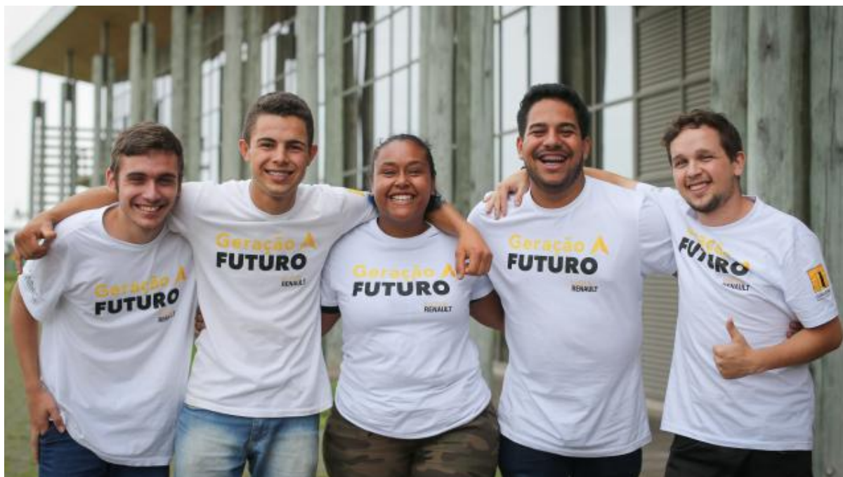
Figura 2: Jovens formandos da primeira turma do Geração Futuro, em 2019, contratados pela Renault do Brasil.

Um vídeo de 5 minutos apresentando o programa e os depoimentos foi exibido no evento e logo em seguida foram apresentados aos presentes, gestores da Renault e familiares dos jovens, os novos colaboradores que passariam a integrar o time Renault.